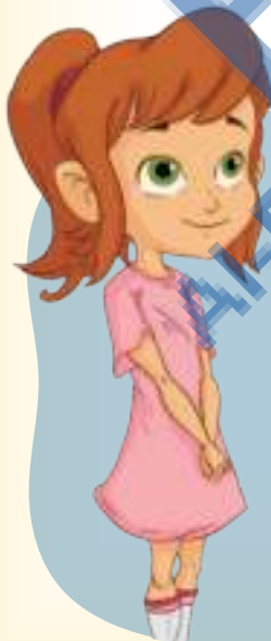
Une demoiselle (mademoiselle)