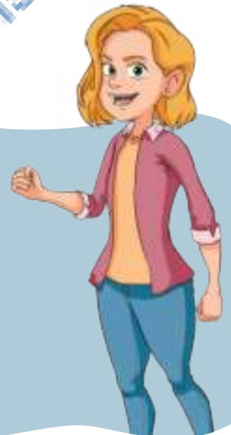
Une dame (madame)