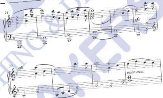
Deux noires : deux notes de musique