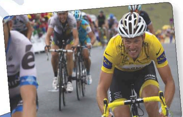
Le maillot jaune du tour de France