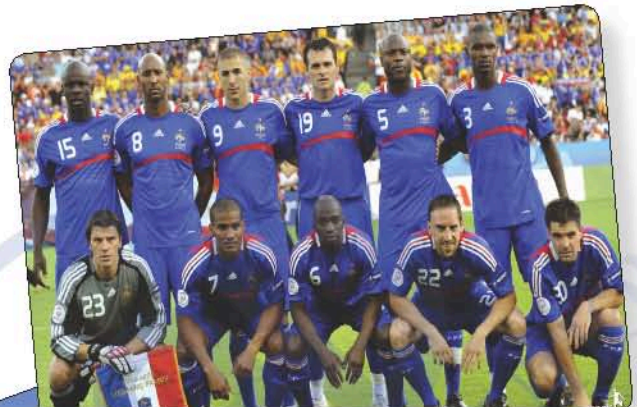
Les bleus : l'équipe nationale de France de football ou de rugby