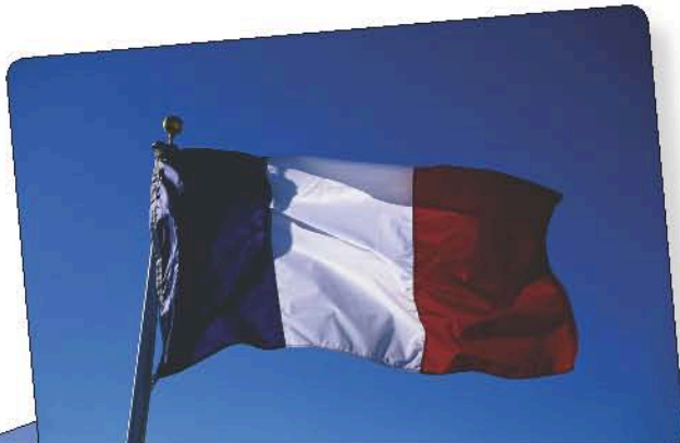
Le drapeau français bleu, blanc, rouge