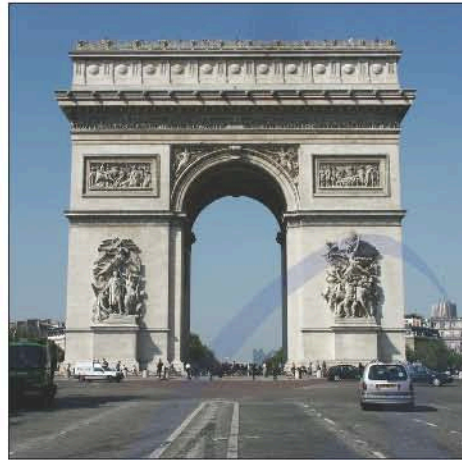
L'Arc de Triomphe