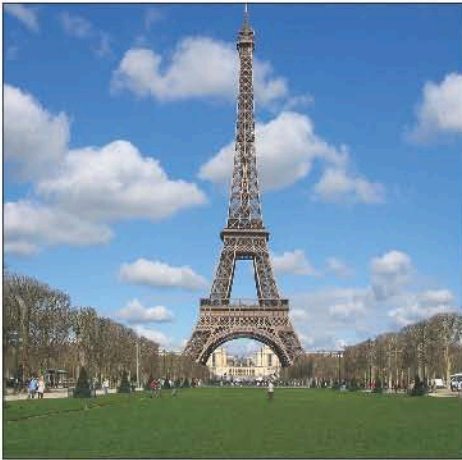
La Tour Eiffel