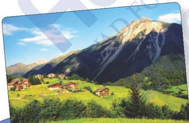
Le Mont-Blanc, dans les Alpes (4 807 m)