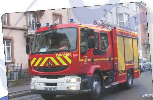
Le camion des pompiers (ou fourgon d'incendie) rouge français