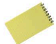
le cahier de dessin