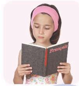
un livre de français