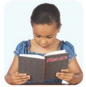
un livre d'histoire