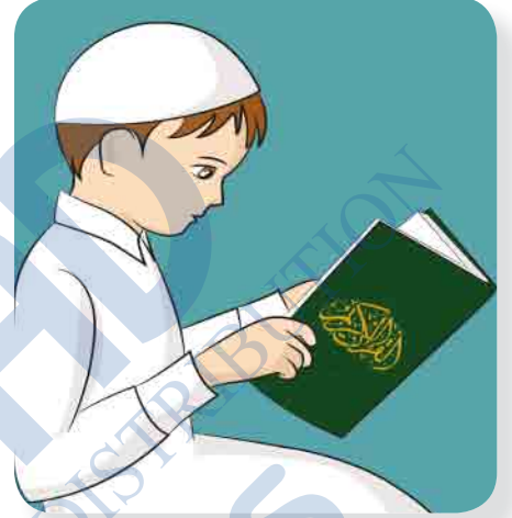
عِنْدَ قِرَاءَةِ الْقُرْآنِ الْكَرِيمِ