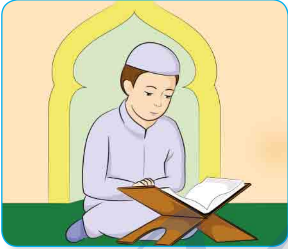
أُحِبُّ تِلَاوَةَ الْقُرْآنِ الْكَرِيمِ