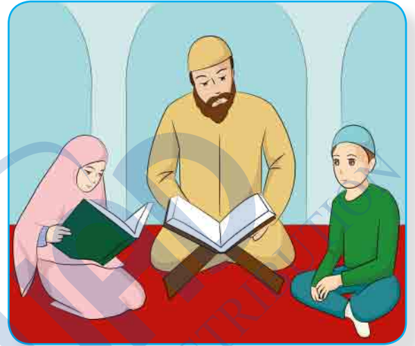
أَسْتَمِعُ لِتِلَاوَةِ الْقُرْآنِ الْكَرِيمِ