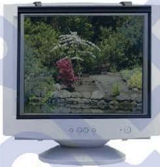
شاشة مع فلتر