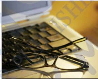
نظارة خاصة للحاسوب