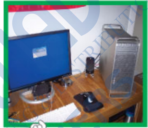
المعدات (مكونات الحاسوب) (Hardware)