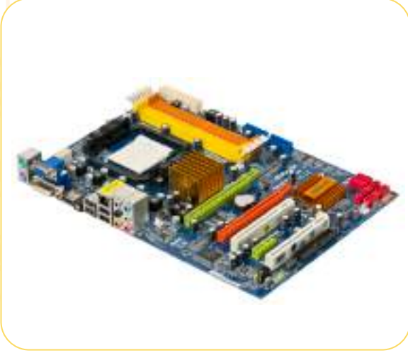
● اللوحة الأم (Mother Board)