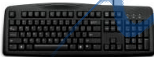
1. لوحة المفاتيح Key Board