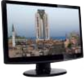
1- الشاشة Monitor