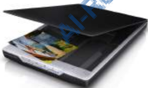
3. الماسحة الضوئية Scanner