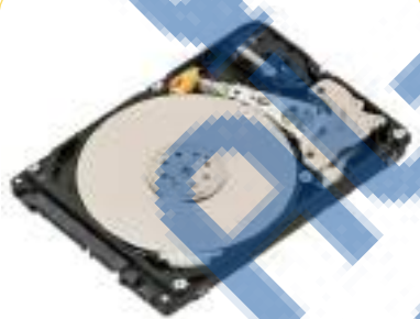
4- القرص الصلب (Hard Disk)