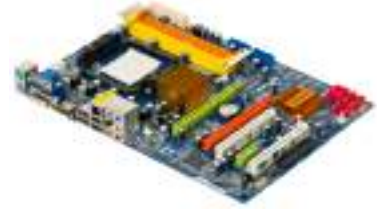
1- اللوحة الأم (Mother Board)