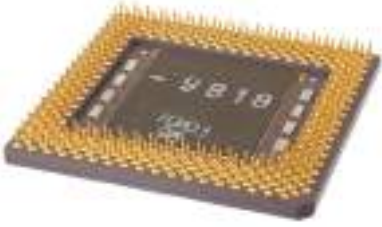
2- وحدة المعالجة المركزية (CPU)