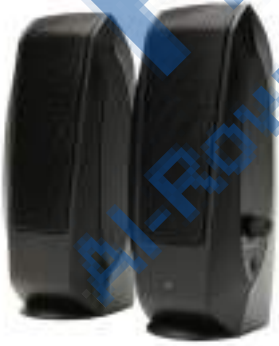
3- مكبر الصوت (speaker)