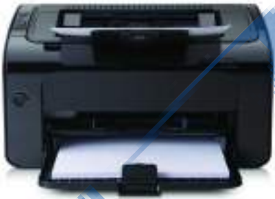
2- الطابعة (Printer)