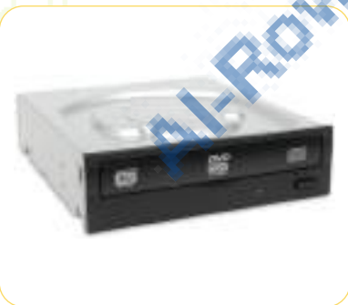
5- مشغل الأقراص الليزري (CD Drive)